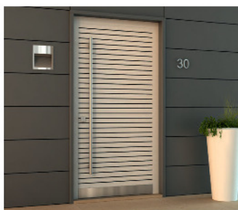
mf5 - a filo