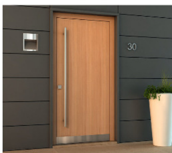
mf1 - a filo