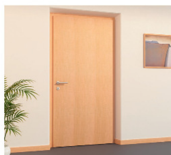
modern decor (Int.)