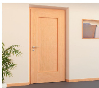
modern panel (int.)