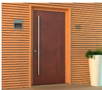
mf4 - a filo