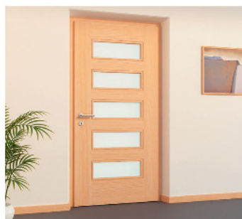
modern modular (int.)