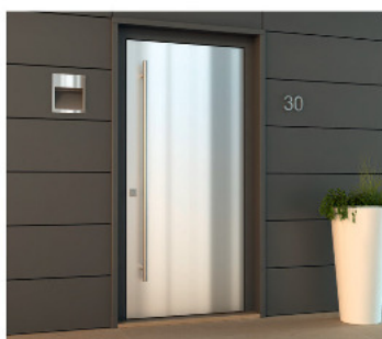
mf2 - a filo