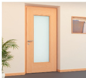
modern inox (int.)