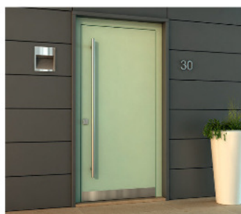
mf3 - a filo